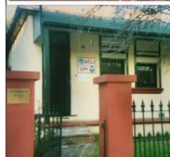
Vecchia sede di Sydney (sinistra) e sede di Melbourne (sopra)