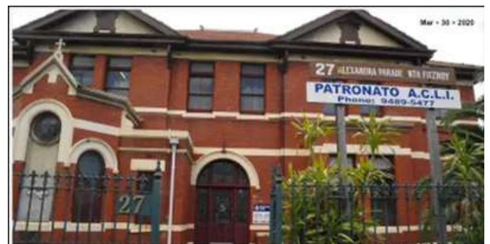
Articolo di giornale dedicato all'apertura delle sedi Acli Australia