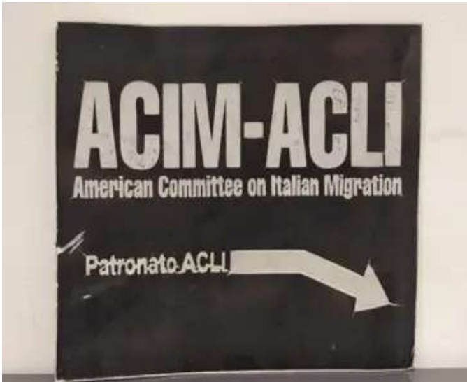
Antica targa dell'ufficio ACIM-ACLI

Se la mia storia con le ACLI inizia nel settembre 2023, quella delle ACLI con gli Stati Uniti è decisamente più lunga. Le ACLI sono infatti approdate negli Stati Uniti nel 1952 quando l'ACIM (American Committee of Italian Immigration), associazione statunitense già attiva sul territorio, chiese alle ACLI di aprire degli sportelli di Patronato e condividere con loro la sede di New York come ACIM-ACLI, per fornire consulenza e assistenza agli immigrati di origine italiana in materia di prestazioni di sicurezza sociale, tassazione dei redditi, diritto del lavoro e diritti in materia di immigrazione. L'organizzazione contribuiva, inoltre, a diffondere la cultura italiana negli Stati Uniti.