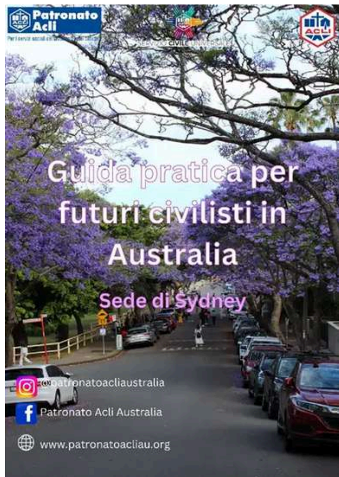
Copertina della nostra guida

Australia, è consultabile gratuitamente e può essere utile anche a coloro che non vogliono intraprendere un percorso di Servizio Civile Universale.