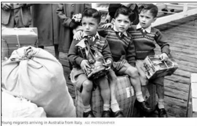
Young migrants arriving in Australia from Italy.

Durante tutto il 1900, l'Australia è stata caratterizzata da tre diverse correnti migratorie, ma è solo alla fine della terza, ovvero quella degli anni '50/'60, che viene fuori un forte senso di comunità tra gli immigrati italiani. Si cominciano a creare anche delle associazioni, come la Dante Alighieri Society e il Co.As.It, che aiutano l'aggregazione tra italiani.